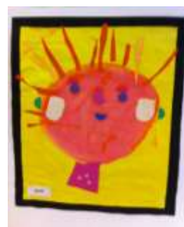
Figures 12 et 13