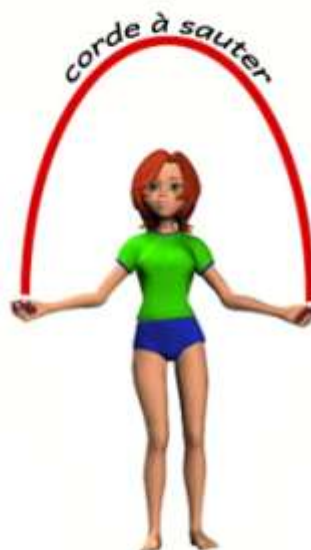
corde à sauter