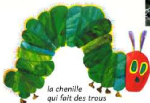
la chenille qui fait des trous